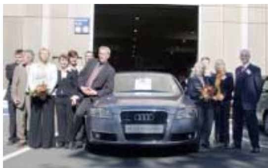
Bild: Preisverleihung DMEuro, auf der Messe -Start-, in Essen.

Der Audi A6 ging somit als Hauptgewinn nach Obing und die BLUES druckt seitdem auf einem nagelneuen Farblaser Drucker des Sponsors BROTHER.